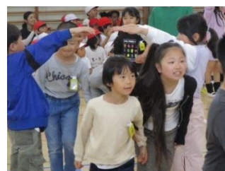
一年生を迎える会

校庭の木々が鮮やかな若葉に包まれ、爽やかな風が吹く季節となりました。先日はご多用の中、全校保護者会に多くの方にご参会いただき、誠にありがとうございました。新年度がスタートして一か月。4月の「一年生を迎える会」では、上級生が心を込めて会の準備や運営を行う姿と、それに応える一年生の笑顔が見られ、学校全体が温かい絆でつながっていく様子に嬉しく思いました。