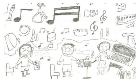
2年 ○○ ○○さん