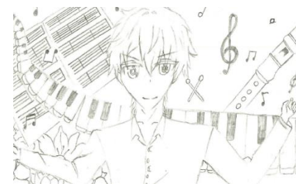
6年 ○○ ○○さん