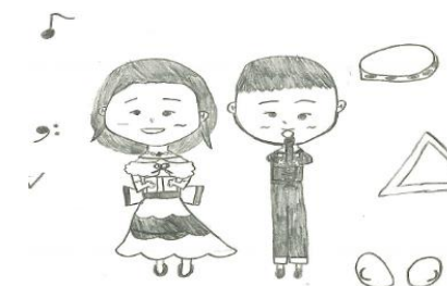
4年 ○○ ○○さん